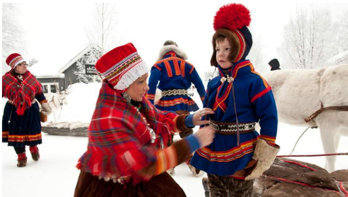
Laponski/Saami narod u narodnoj nošnji

Upravo o problemu diskriminacije laponskog naroda govori film Laponska krv , posebice se fokusirajući na rasizam švedske države 1930-ih godina prema pripadnicima toga naroda. Redateljica Amanda Kernell i sama je iskusila diskriminaciju, naime, njezin je otac Laponac, a majka Šveđanka. Laponci su u to vrijeme morali pohađati švedske škole u kojima im se nametao švedski jezik i kultura, no nakon toga nije im bilo omogućeno daljnje obrazovanje pod objašnjenjem da su njihovi mozgovi premali i da nisu sposobni shvatiti gradivo . Vlasti su ih tako držale na jednom mjestu, izolirane, smatrajući ih jedino dobrim da se bave životinjama.