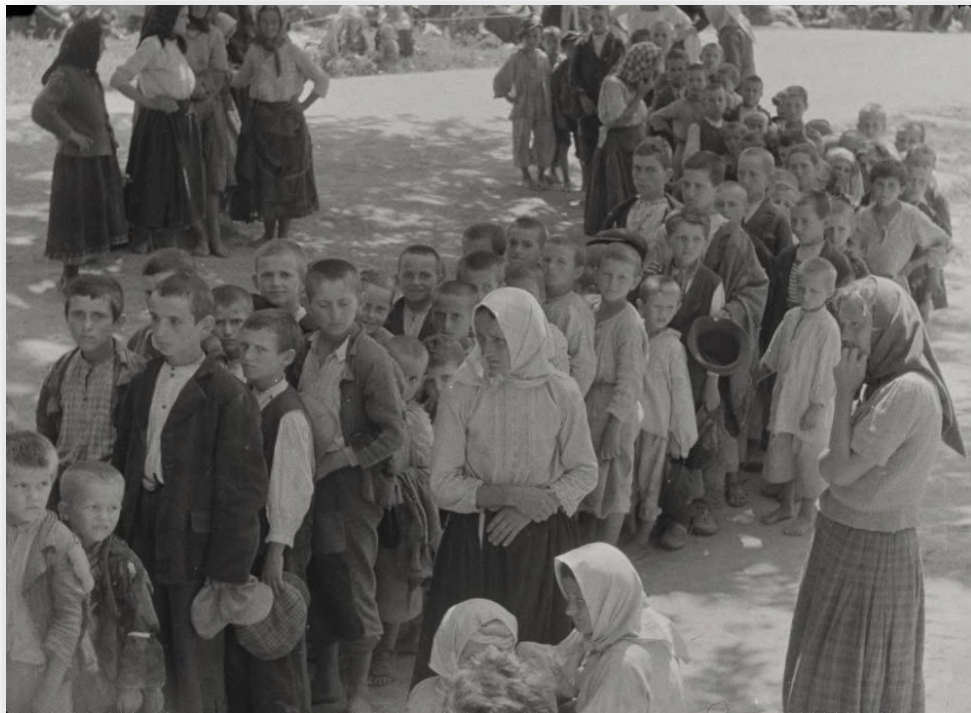
Primjer arhivske snimke korištene u filmu

(Preuzeto iz intervjuja: https://www.jutarnji.hr/kultura/film-i-tv/kako-sam-snimila-pricu-ozeni-koja-je-spasila-vise-od-10000-srpske-djece/9128990/ i http://www.novolist.hr/Scena/Film/Dianina-lista-je-prica-o-najboljim-ljudima-u-najgorim-vremenima?meta_refresh=true )